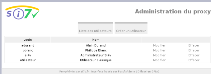
Actions sur les utilisateurs existants

Les utilisateurs peuvent être ajoutés, modifiés, supprimés simplement depuis un panel développé par Si7v.