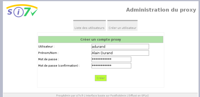
Ajout d'un nouvel utilisateur